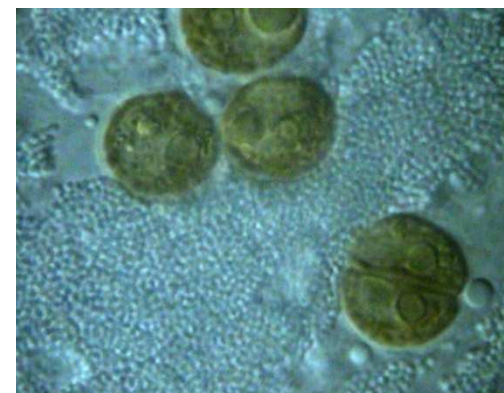
3. Microscope à contraste de phase (x8000)