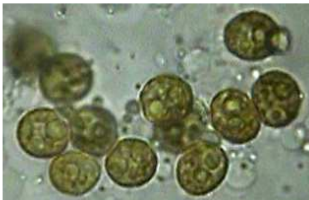
2. Microscope optique (x 5 000)