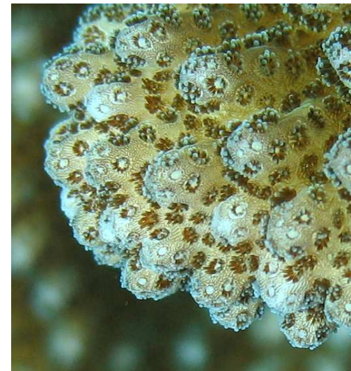
Détail d'un Pocillopore