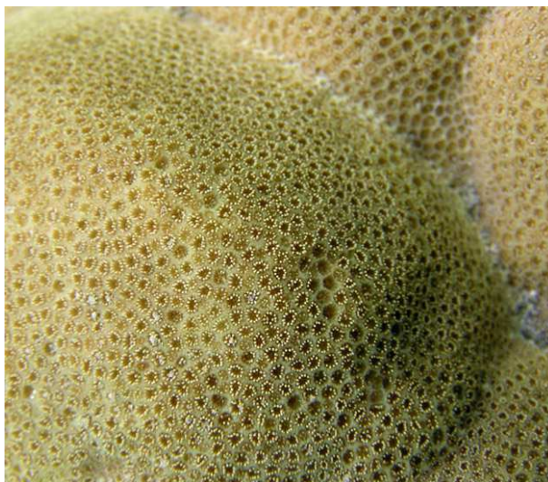
Détail de la surface d'un Porites