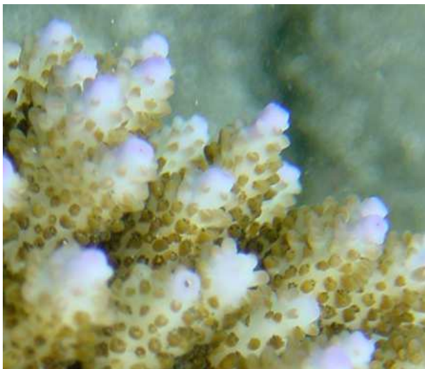
Détail de branches d'un Acropore